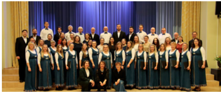
Kammerkoor Kolm Lindu ja Oonurme segakoori ühiskontsert.

Samasse kuusse jäi ka meeleolukas Avijõe kanuuretk ning stiilipidu-tantsuõhtu „Loomad on lah-