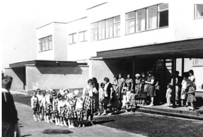
Esimene kevadpidu uue hoone juures 1988. aastal.