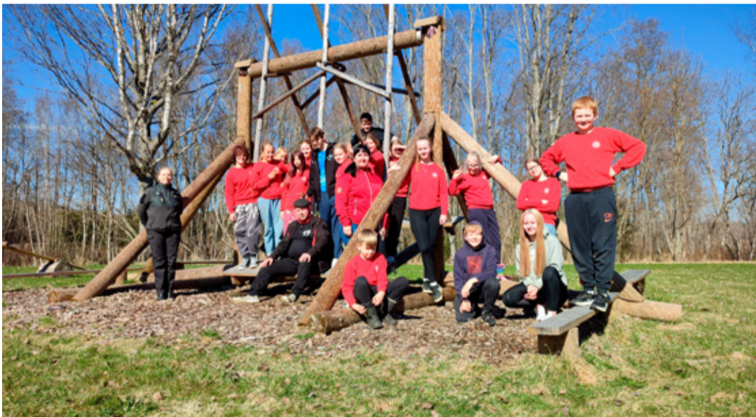
Avinurme ja Nõo noored päästjad.

Lisaks teadmiste ja oskustele oli laagri üheks suurimaks väärtuseks uute tutvuste loomine. Noored said omavahel paremini tuttavaks, jagasid kogemusi ning löid sõprussuhteid, mis kannavad edasi ka tulevikus. Koolivaheaeg on küll täies hoos, kuid meie noorpäästjad kasutavad seda aega sisukalt – õppides, arenedes ja üksteist toetades.