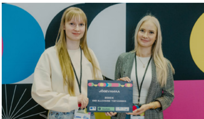
„Käpa ideevabrik“ idee autorid.