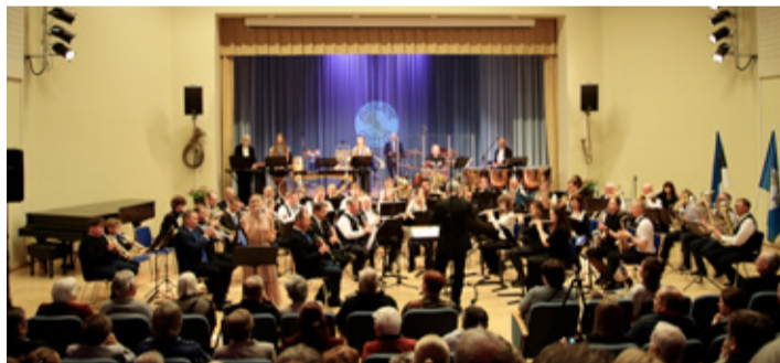
Kontsert „140 aastat puhkpillimuusikat Avinurmes“.

Kontserdiga „140 aastat puhkpillimuusikat Avinurmes“ tähistasimegi seda uhket versta posti.