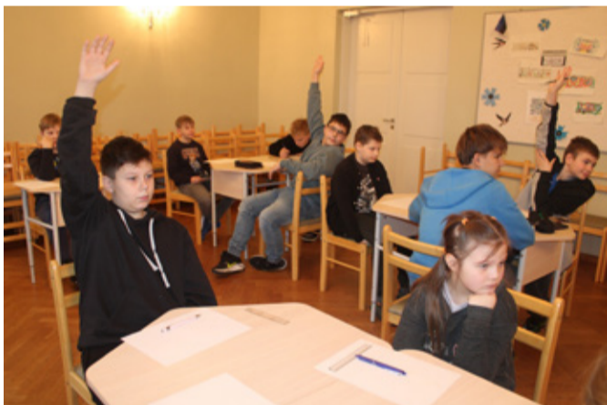
Känguru võistlus Mustvee koolis.