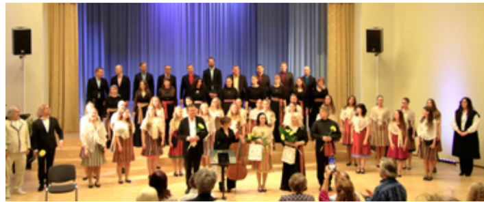
Galakontsert „Juurtega kodukülas“.