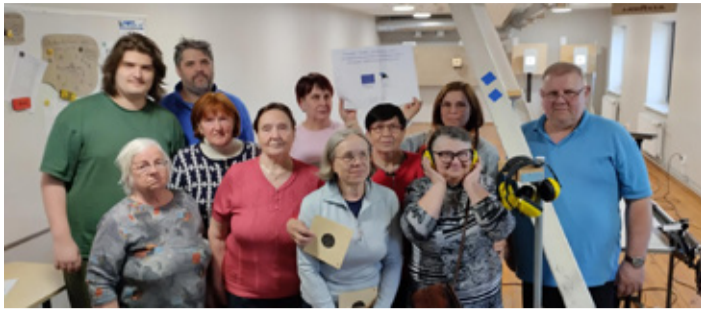
Koolitusel osalejad Mustvee lasketiirus.

Järgmise etapina oleme planeerinud koolitussarja „Õhk- ja tulirelva laskmise võimalustest“, mis on suunatud Kasepää, Raja