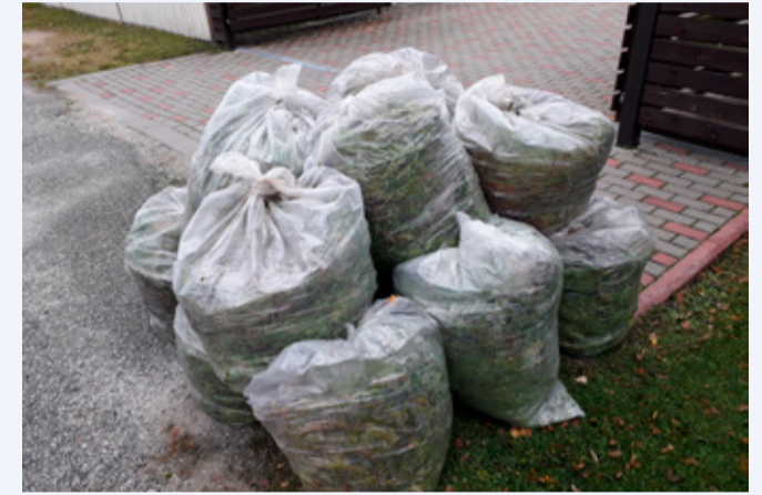
Nõuetekohaselt välja pandud aiajäätmed.

**** AS Eesti Keskkonnateenused osutab konteinerite transporditeenust tasuta veoperioodi algul esimese kolme kuu jooksul (st kuni 31.01.2023) ja ühe kuu jooksul veoperioodi lõppemisel (30.04.2027).